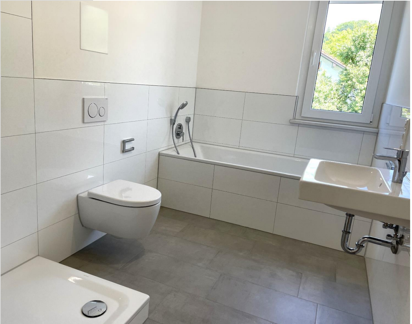
Badezimmer (Abbildung zeigt Sonderwunsch)