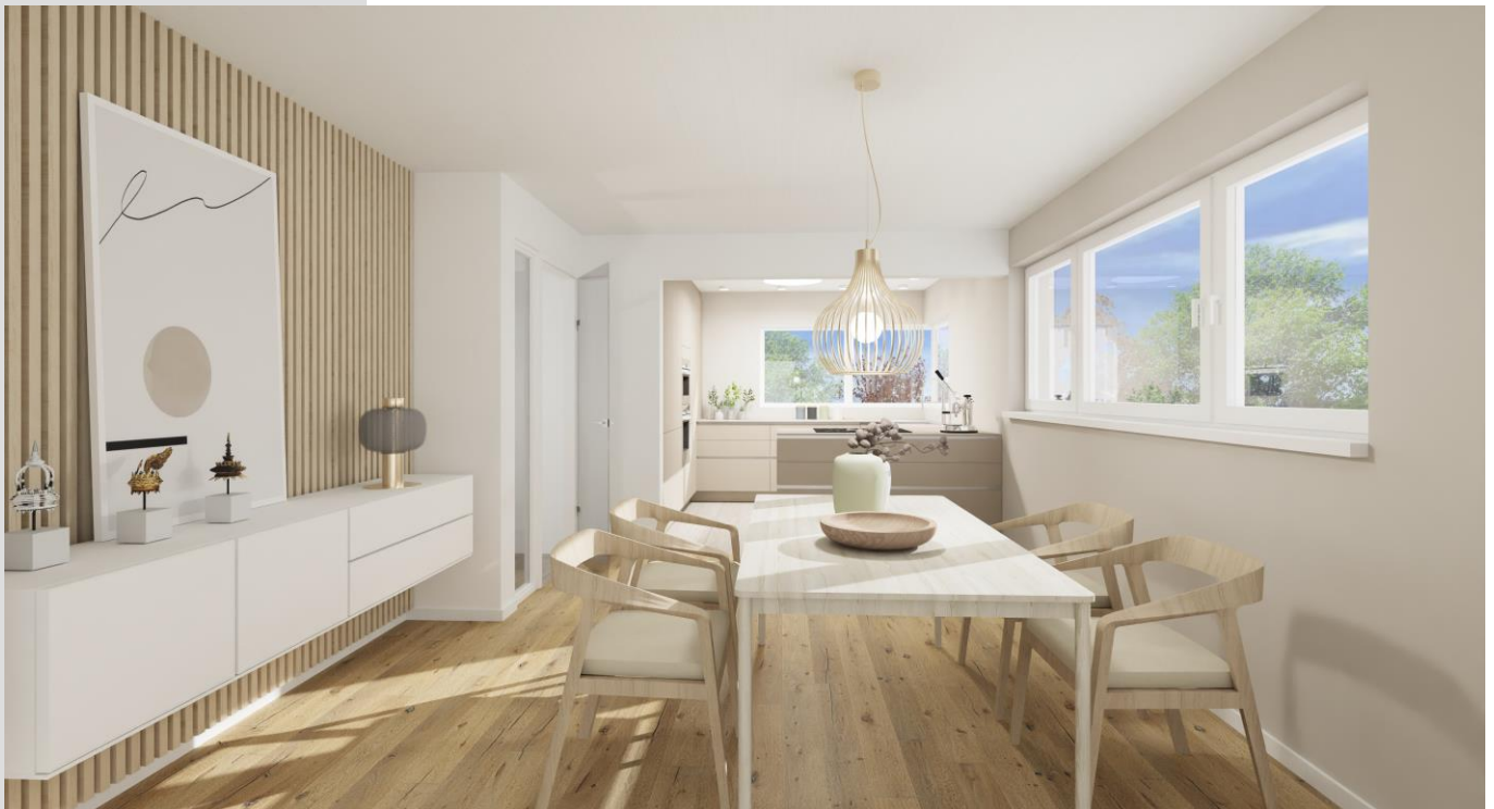
sonnendurchflutetes Kochen und Essen