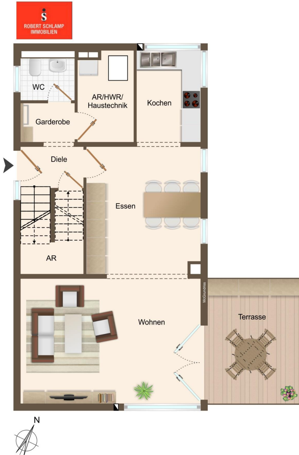
großzügiger Grundriss Erdgeschoss