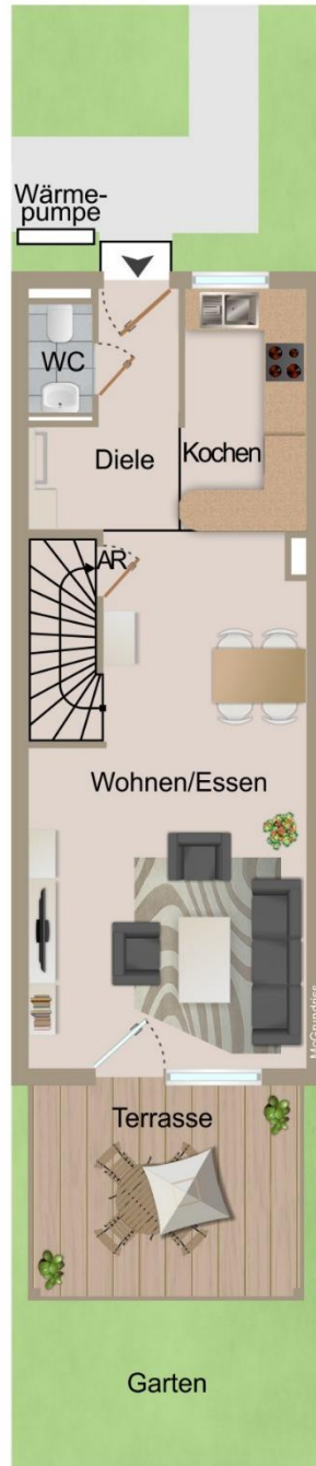
Grundriss Erdgeschoss RMH 7